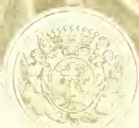
Bignon Abbas Abbas Bignon